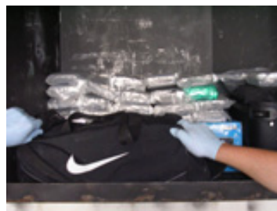
Briques de cocaïne à l’intérieur de l’unité de réfrigération

Les agents de l’ASFC s’efforcent d’empêcher l’entrée de drogues illégales et autres produits de contrebande au Canada. Depuis 2007, des agents de la région du Pacifique ont saisi 1,35 tonnes de cocaïne. Ces saisies contribuent grandement à assurer la sécurité des communautés canadiennes.